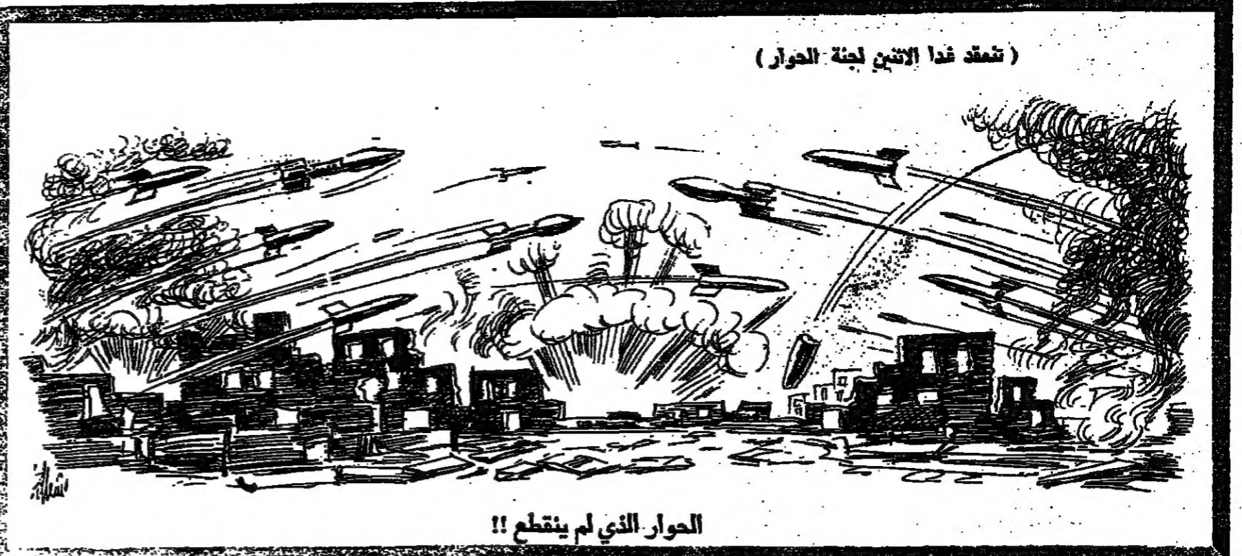
الحوار الذي لم ينقطع !!

صيدا - من مراسلنا : «الانوار» : اصدرت فصائل المقاومة الفلسطينية بقيادة الحركة الوطنية في صيدا بيانا أمس ، ومد اجنحة عرضت فيه الارادة حول دهنه الاوضاع في البلاد ، وجاء في البيان : حرما من الحركة الوطنية والمقاومة على تقييد الفرص على الرجعية والمخططات الحربية لتسليم الضفة الفلسطينية والتزامها بالانضباط السياسي والمصري للوصول الى الاهداف التي تحمها الحركة الوطنية ، لا تقصد تقرب :